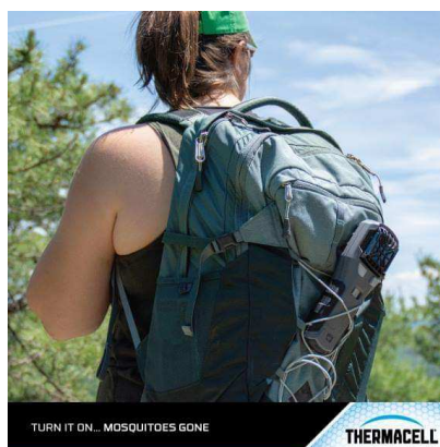
TURN IT ON... MOSQUITOES GONE